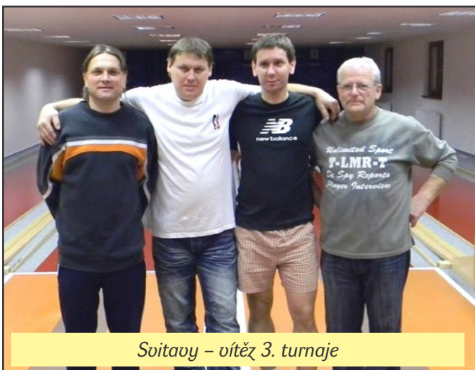
Svitavy – vítěz 3. turnaje